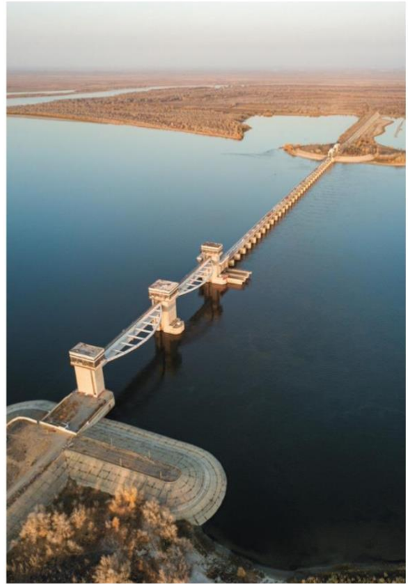
Вододелитель в Нариманове