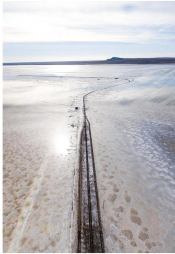
Соленое озеро Баскунчак